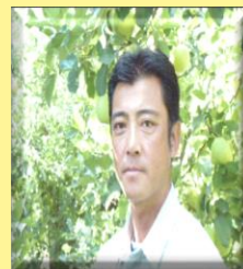
株式会社シャンティ よっちやんりんご園主

〒984-0065 宮城県仙台市若林区土樋236番地 コミュニティデザイン合同会社 りんごオーナー事務局宛 TEL 070-2029-8952 FAX 022-399-9580 E-mail: world-23@soleil.ocn.ne.jp URL : https://cmtdesign.theshop.jp